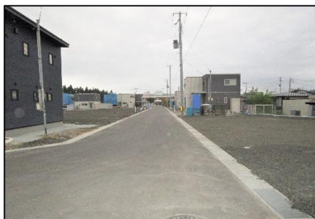
現地写真(撮影日:H30. 5. 16 18時頃 曇り)