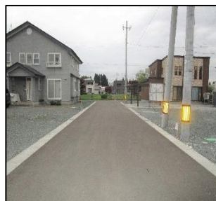
現地写真(撮影日:H30. 5. 16 18時頃 曇り)